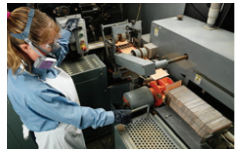
Envoltura de placas automatizadas

Aunque hay más de una docena de pasos para construir las Baterías Renovables de Crown, Crown Battery emplea varios procesos únicos que otros fabricantes de baterías no pueden igualar.